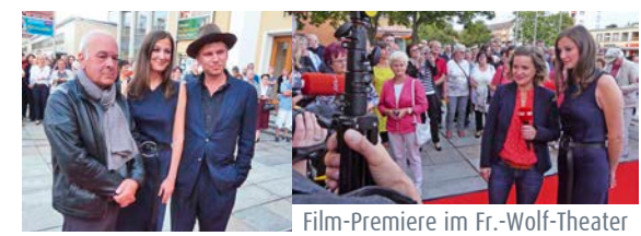
Film-Premiere im Fr.-Wolf-Theater