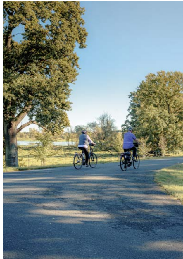
»Die Oder im Blick« auf dem Oder-Neißeradweg